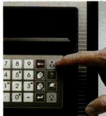
3. Presione cargar muestra: Obtenga los resultados