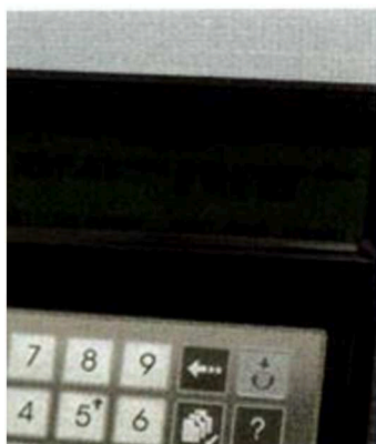
1. Seleccione el grano,